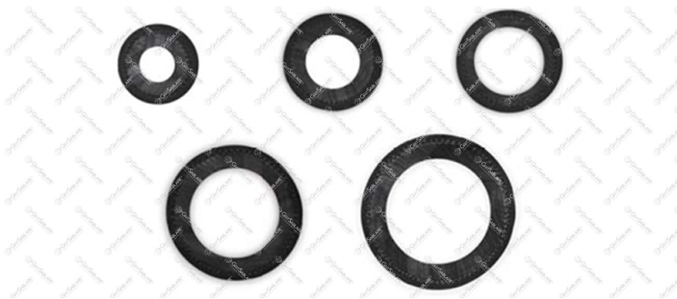
Secțiune furtun de sablare – strat interior, întăritură textilă, înveliș exterior